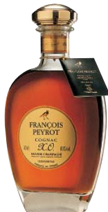
COGNAC CARAFE XO